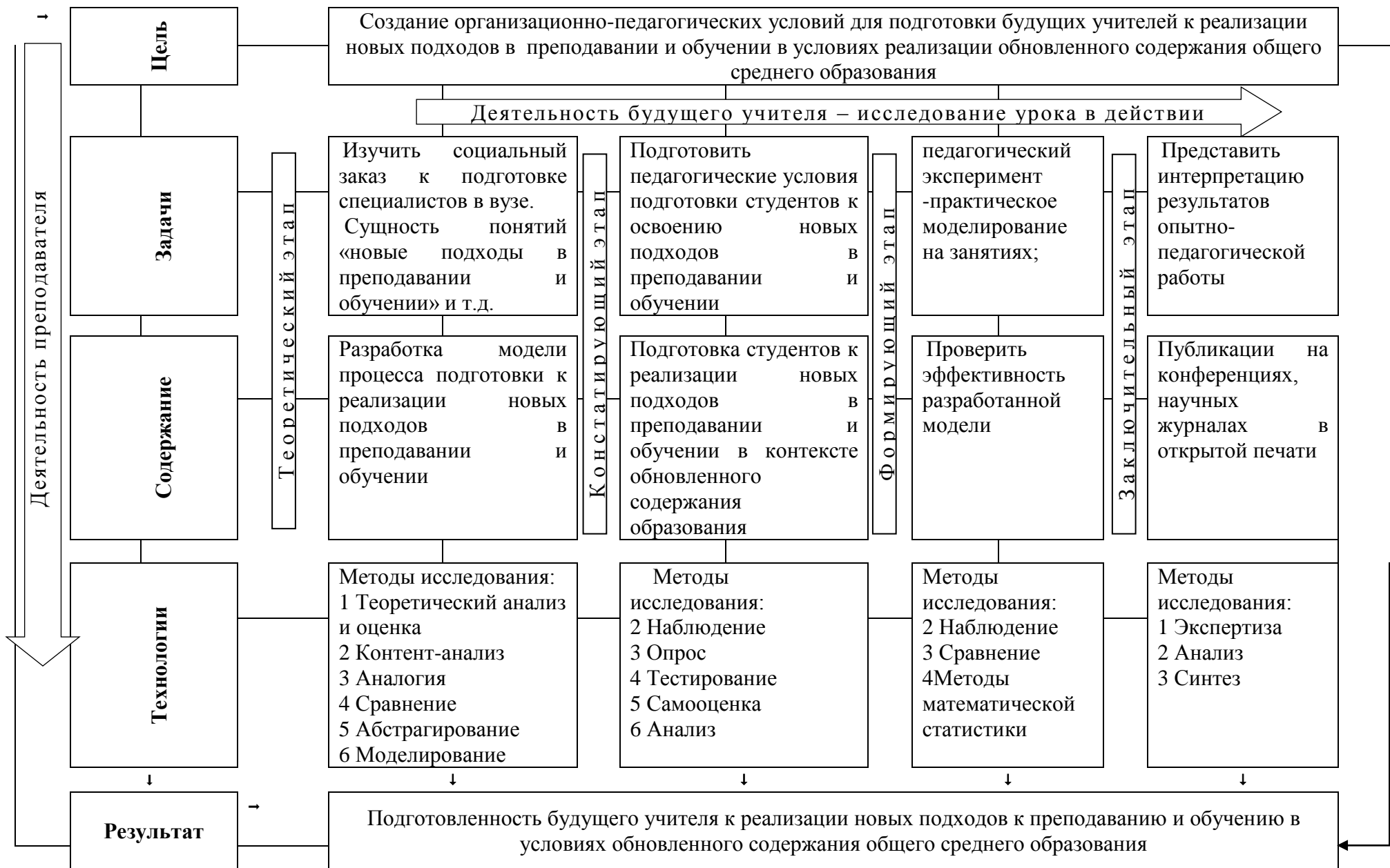
Рис. 1. – Структурно-содержательная модель подготовки будущих учителей к новым подходам в преподавании и обучении в условиях обновленного содержания общего среднего образования